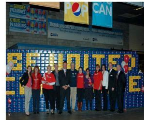
Lancement de campagne de Pepsi

Votre persévérance contribue au succès de la campagne 2010 de Centraide Outaouais !